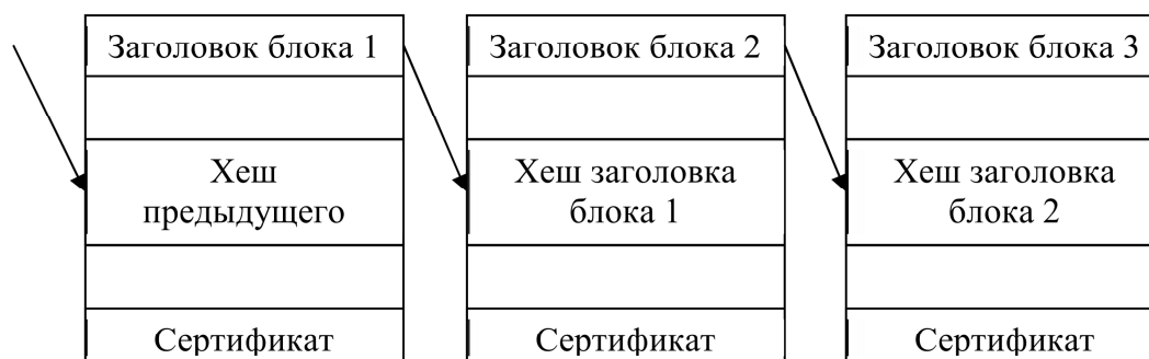
Рисунок 1 - Схема PKI на основе blockchain-технологии [2]

Криптографические методы активно используются для обеспечения безопасности различных областей. В связи этим исследователи разрабатывают новые криптопримитивы, решающие различные проблемы. Одним из таких криптопримитивов является технология сцепления блоков транзакций (Blockchain) [1]. Наиболее известным применением данной технологии - электронные наличные. Однако blockchain-технология может реализовывать не только аспекты криптоэкономики, но и другие элементы, требующие распределенного хранения и некоторого подтверждения. Таким примером может послужить инфраструктура открытых ключей (PKI) (рисунок 1) [2].