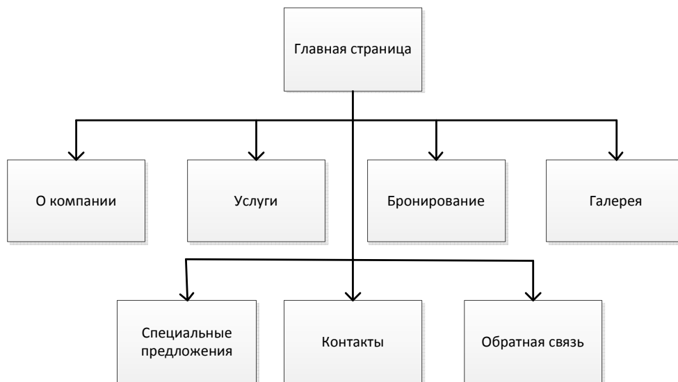
Рис. 1. Типовая структура web-представительства гостиничного комплекса.

На основе полученных в результате проведенного исследования данных была разработана типовая структура web-представительства (рисунок 1), логическая схема главной страницы (рисунок 2) и типовая форма бронирования (рисунок 3).